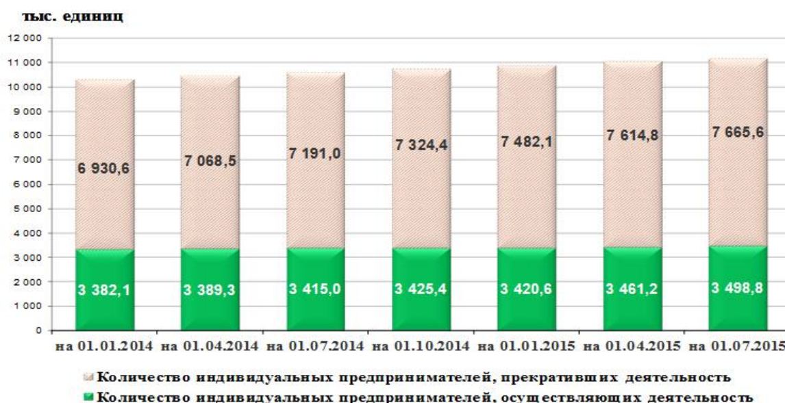
Количество индивидуальных предпринимателей, сведения о которых содержатся в Едином государственном реестре индивидуальных предпринимателей

Однако какое качество несут эти данные? Неизвестно, сколько из этих индивидуальных предпринимателей на самом деле являются