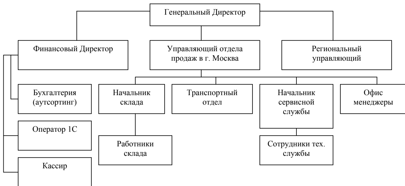
Рис. 1.2. Организационная структура управления ООО «XXX»