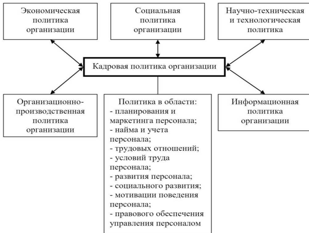
Рис. 1.1 Место и роль кадровой политики в политике организации