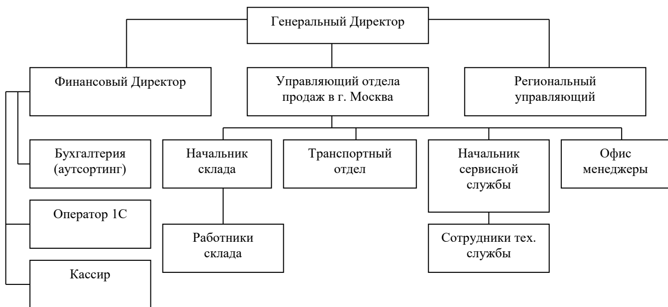
Рис. 1.2. Организационная структура управления ООО «XXX»