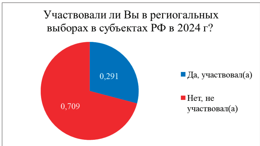
Рис. 2. Численность студентов участвующих в региональных выборах в субъектах РФ в 2024 году