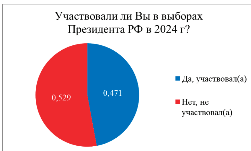
Рис. 1. Численность студентов, участвующих в выборах Президента РФ в 2024 году

Обобщенный анализ статистических результатов показывает, что многие студенты не видят необходимости участия в выборах в целом, в связи с недоверием к избирательной системе и наличием сомнений по поводу про-