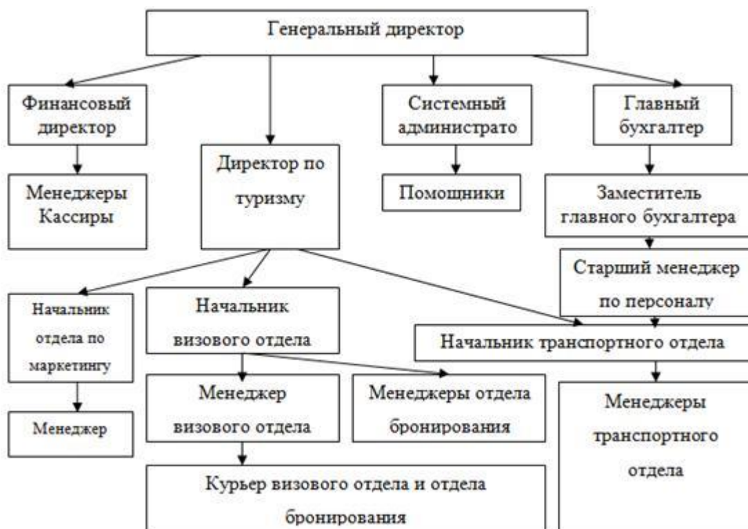
Рисунок 1 - Организационная структура управления ООО «XXX»