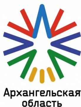
Рис. 1. Туристский бренд Архангельской области

Печать основного текста после наименования рисунка начинается через два полуполных междустрочных интервала.